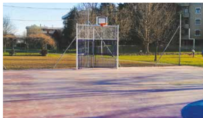
Nel parco di Via Toscana , quasi terminati i lavori per il nuovo campo da basket (foto sopra) e la pista da skate (foto sotto), per un valore di 157.000 euro.