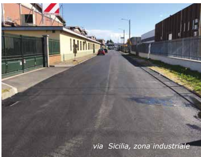
via Sicilia, zona industriale

E' inoltre in programma il collegamento con Carpianello : sarà realizzato il tratto che da via Boccaccio porta alla rotonda di via Trieste con il conseguente collegamento con la ciclabile che porta su via Repubblica e/o lungo via Dalla Chiesa/via Brigate Partigiane.