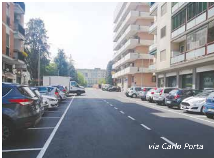
via Carlo Porta

Stanno per concludersi i lavori partiti lo scorso marzo per migliorare la viabilità e rendere strade e marciapiedi più sicuri e accessibili , in diverse zone della città, compresa quella industriale di Civesio e Sesto Ulteriano.