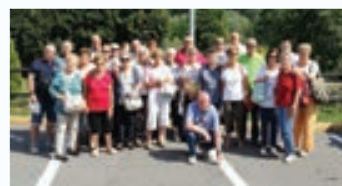
Monclassico - Trento