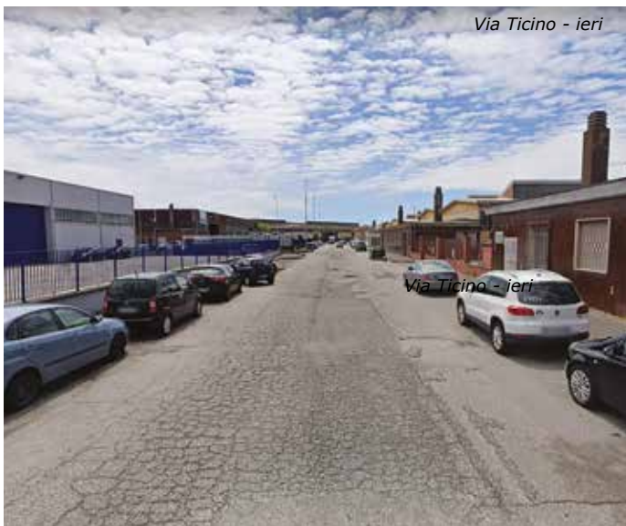
Via Ticino - ieri

Prima di dare il via ai lavori, l'Amministrazione ha convocato lo scorso 28 ottobre in Municipio le principali aziende di Sesto Ulteriano per illustrare il progetto e le caratteristiche degli interventi, ma anche per ascoltare suggerimenti e proposte finalizzate a migliorare complessivamente questa parte di San Giuliano sotto diversi aspetti, tra cui: viabilità, decoro e sicurezza.