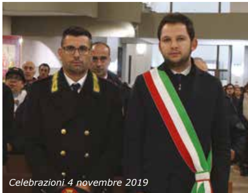
Celebrazioni 4 novembre 2019

Ma la parola chiave del 2019 è stata territorio : non solo per la redazione – ormai quasi conclusa – della proposta di variante generale al Piano del Governo del Territorio che verrà discussa nel primo trimestre 2020 in Consiglio Comunale, ma anche per i molteplici cantieri in Città. La lungimiranza è ciò che come Amministrazione ci ha