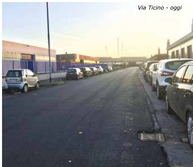
Via Ticino - oggi