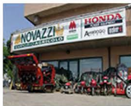
Due punti vendita