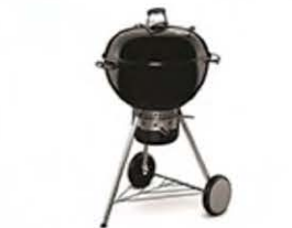
Barbecue - barbecue