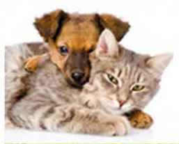
Pet care e pet food