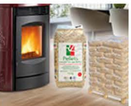
Stufe e pellet