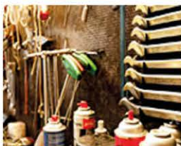
Officina e usato