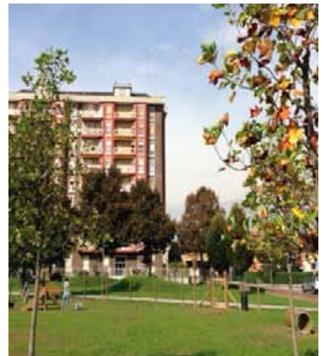
nuova area cani giardini Campoverde