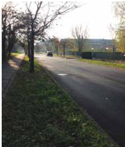
asfaltatura via Gorky