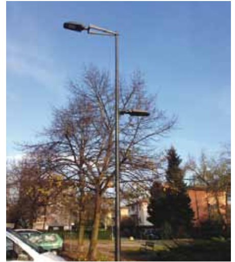
illuminazione a Led via Cavalcanti