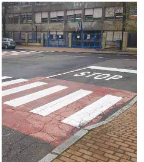
via Bezzeca: asfaltatura fronte scuola e cortile interno