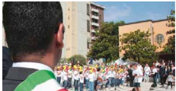
Concerto dei ragazzi della scuola L. da Vinci in occasione della Festa della Repubblica