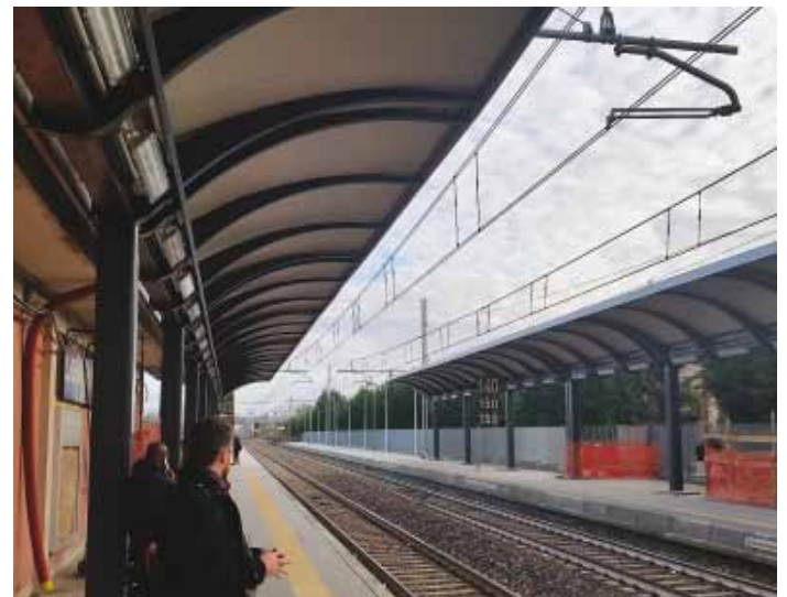
Riqualificazione stazione F.S.