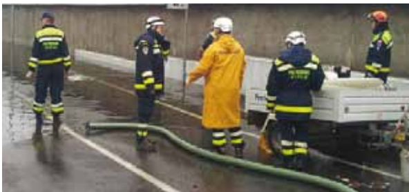
I volontari della Protezione Civile di San Giuliano e del C.O.M. 20 in prima linea per la sicurezza