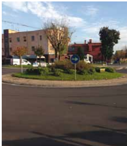
asfaltatura rotonda Brigate Partigiane