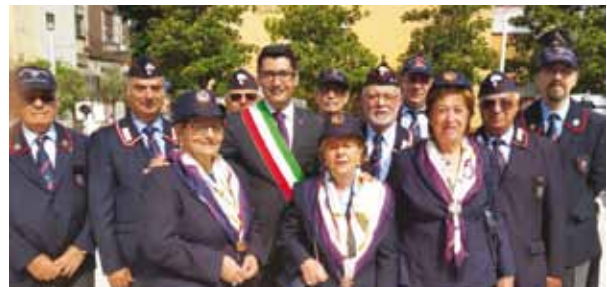
I volontari dell'Ass.Naz. Carabinieri che svolgono da anni un percorso educativo sulla legalità nelle scuole