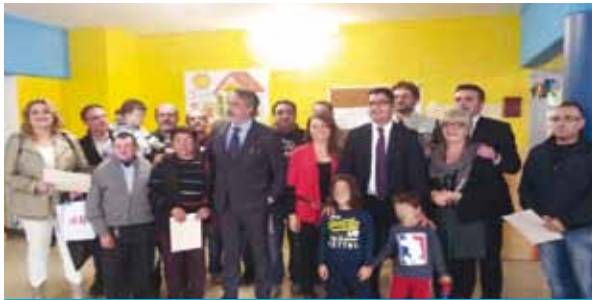
I genitori degli alunni della scuola Gogol che hanno ridipinto le aule