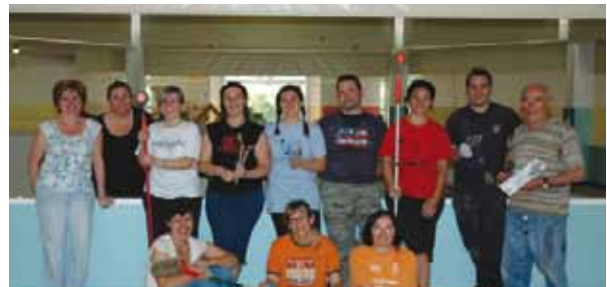
I genitori degli alunni della scuola Marcolini che hanno ridipinto le aule