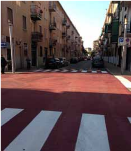
asfaltatura via Turati