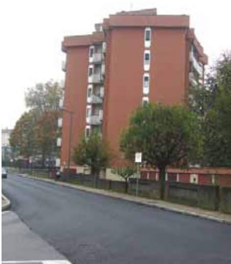
asfaltatura via Cavour