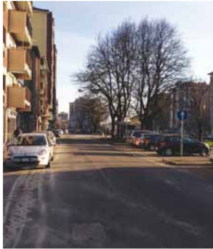
asfaltatura tratto via Milano