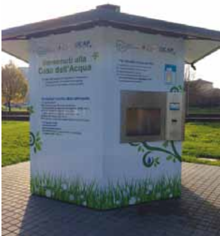
nuova casa dell'acqua Campoverde