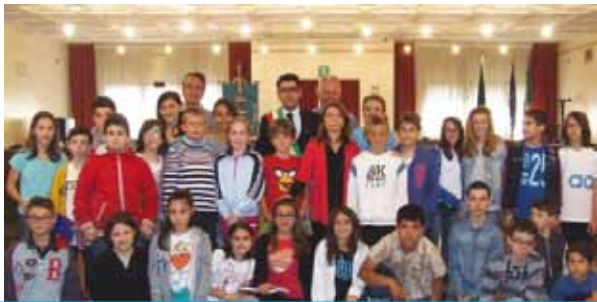
Il nuovo Consiglio Comunale dei ragazzi: a scuola di democrazia!

Un grazie di cuore alle associazioni, ai comitati e a tutti coloro che, anche se non presenti in questa pagina, nell'ambito del loro lavoro o nel tempo libero, attraverso il loro impegno "dietro le quinte" ci rendono orgogliosi di appartenere a questa comunità!